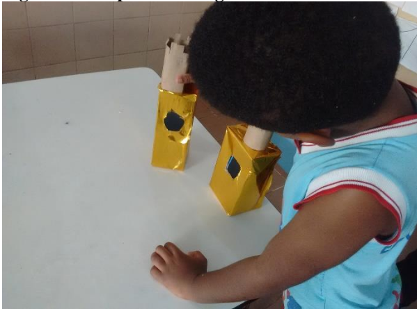
Figura 19 Grupo de montagem