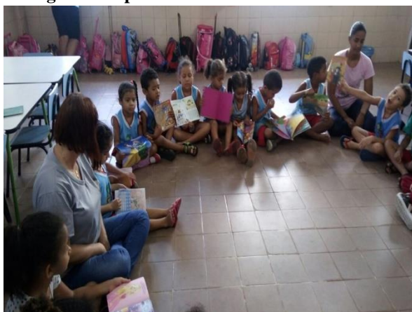
Figura 6 Explicando a escolha do livro

Assim, como, ao ouvir os relatos contados pelos adultos o avanço da oralidade é claro, pois é com este último que a criança tem o poder de expressar suas atitudes e emoção, a prática da leitura contribui para a formação da linguagem verbal.