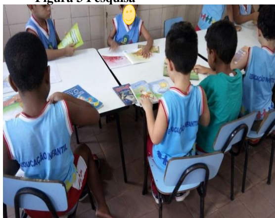
Figura 3 Pesquisa