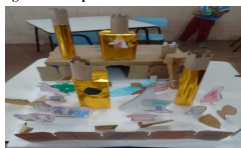
Figura 27 Maquete concluída