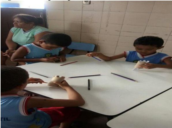
Figura 17 Grupo de pintura