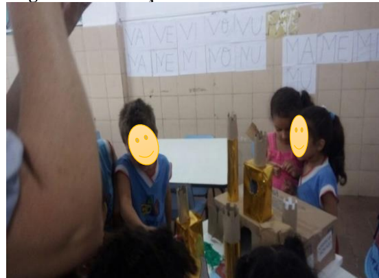
Figura 25 Colocação das árvores e rio