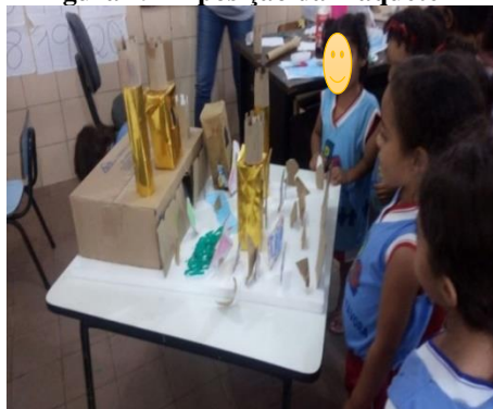
Figura 29 Exposição da maquete