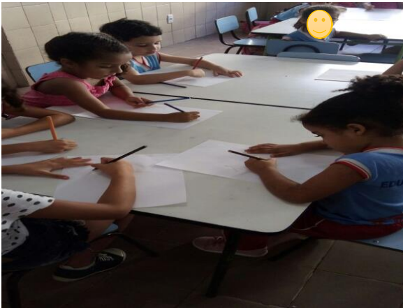
Figura 13 Grupo de desenho