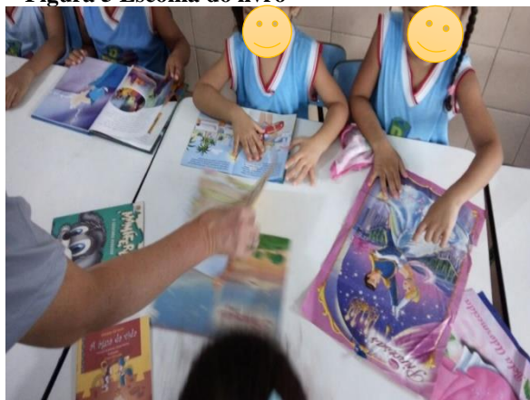
Figura 5 Escolha do livro