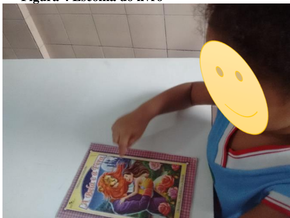
Figura 4 Escolha do livro