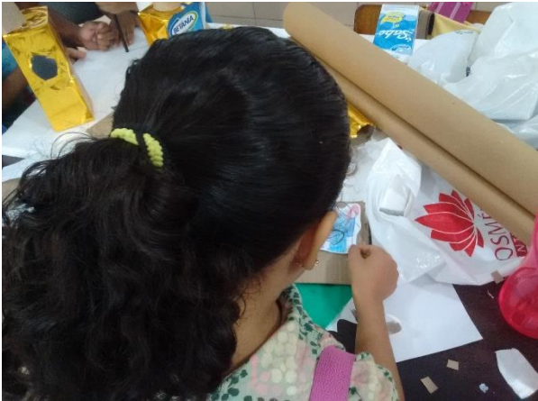
Figura 15 Grupo de colagem