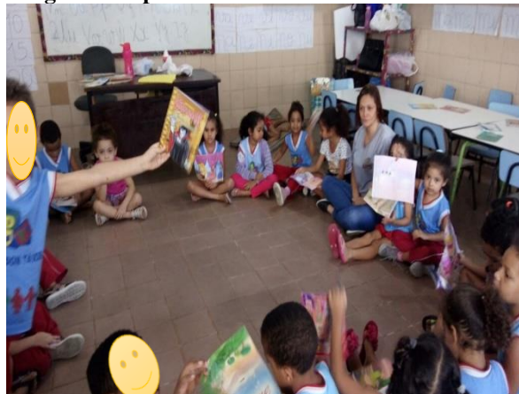
Figura 7 Explicando a escolha do livro