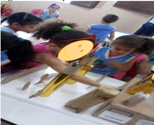
Figura 24 Colocação dos moradores