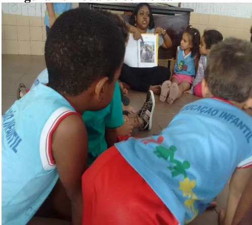
Figura 10 Roda de conversa