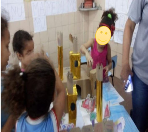
Figura 22 colocação das torres

As figuras 22, 23, 24 e 25 mostram o lugar onde as crianças colocaram os elementos do castelo.