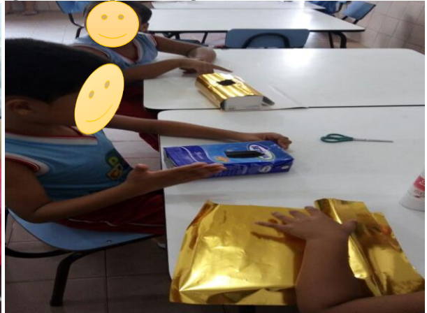
Figura 16 Grupo de colagem