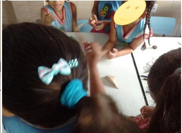
Figura 18 Grupo de pintura