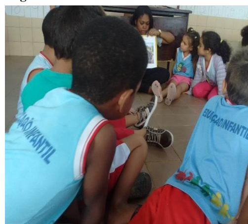
Figura 9 Roda de conversa