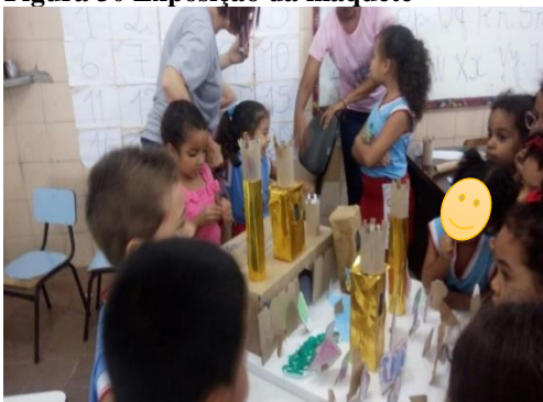
Figura 30 Exposição da maquete