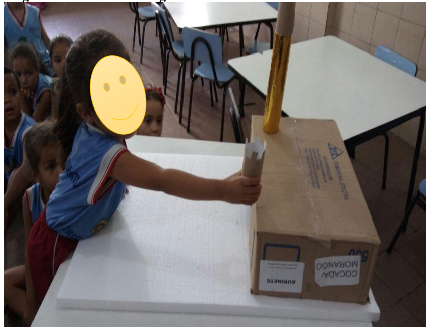
Figura 21 Início da montagem

Quando todos os grupos finalizaram as atividades, fizemos a roda e coloquei todo o material produzidos por eles no chão. Em uma mesa, coloquei o isopor e a caixa de papelão e chamei de um por um para montarmos a nossa moradia medieval, como mostra a figura 21.