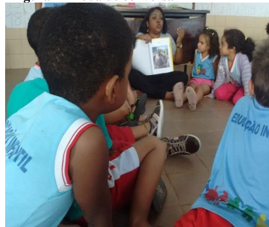
Figura 11 Roda de conversa