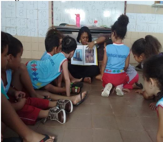
Figura 8 Roda de conversa

“Os cavaleiros, na frente dos castelos com cavalo” outra criança acrescentou: “Para prender quem beijar a princesa e para matar o ladrão.”