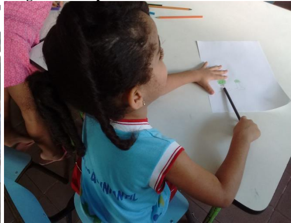
Figura 14 Grupo de desenho