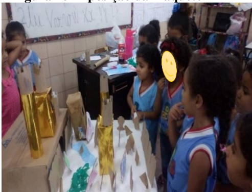
Figura 28 Exposição da maquete

. A princípio os alunos não queriam apresentar, mas depois foram e explicaram tudo que tinha na maquete como mostra as figuras 27, 28, 29 e 30.