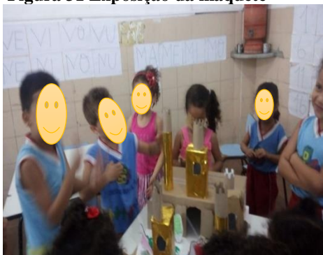
Figura 31 Exposição da maquete