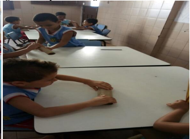
Figura 20 Grupo de montagem