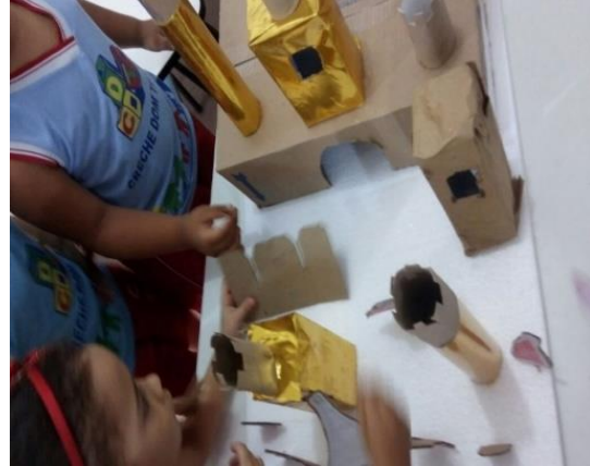
Figura 23 colocação dos muros