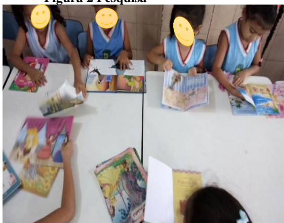
Figura 2 Pesquisa