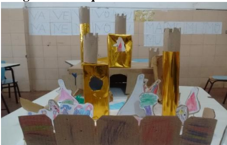
Figura 26 Maquete concluída

As figuras 26 e 27 mostram o resultado do trabalho das crianças. Percebi o interesse em todas em participar. Elas conversavam sobre o que já tínhamos visto na roda de conversa para colocar na maquete. Durante a atividade notamos que a aprendizagem é mais eficaz quando a criança é ativa durante o processo.